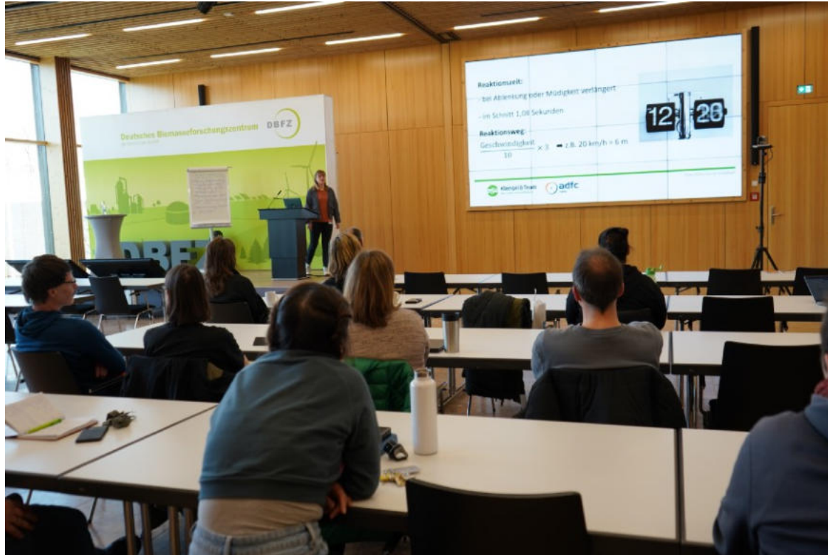
Beispiel Sicherheitstraining Information über Länge des Anhaltewegs