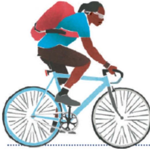
„0,5 % Stark und Furchtlos“