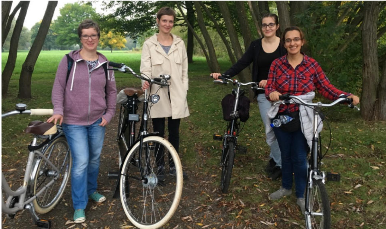
Erfolgreiche Aktivierung: Teilnehmerinnen eines Radfahrkurses für erwachsene Anfänger*innen