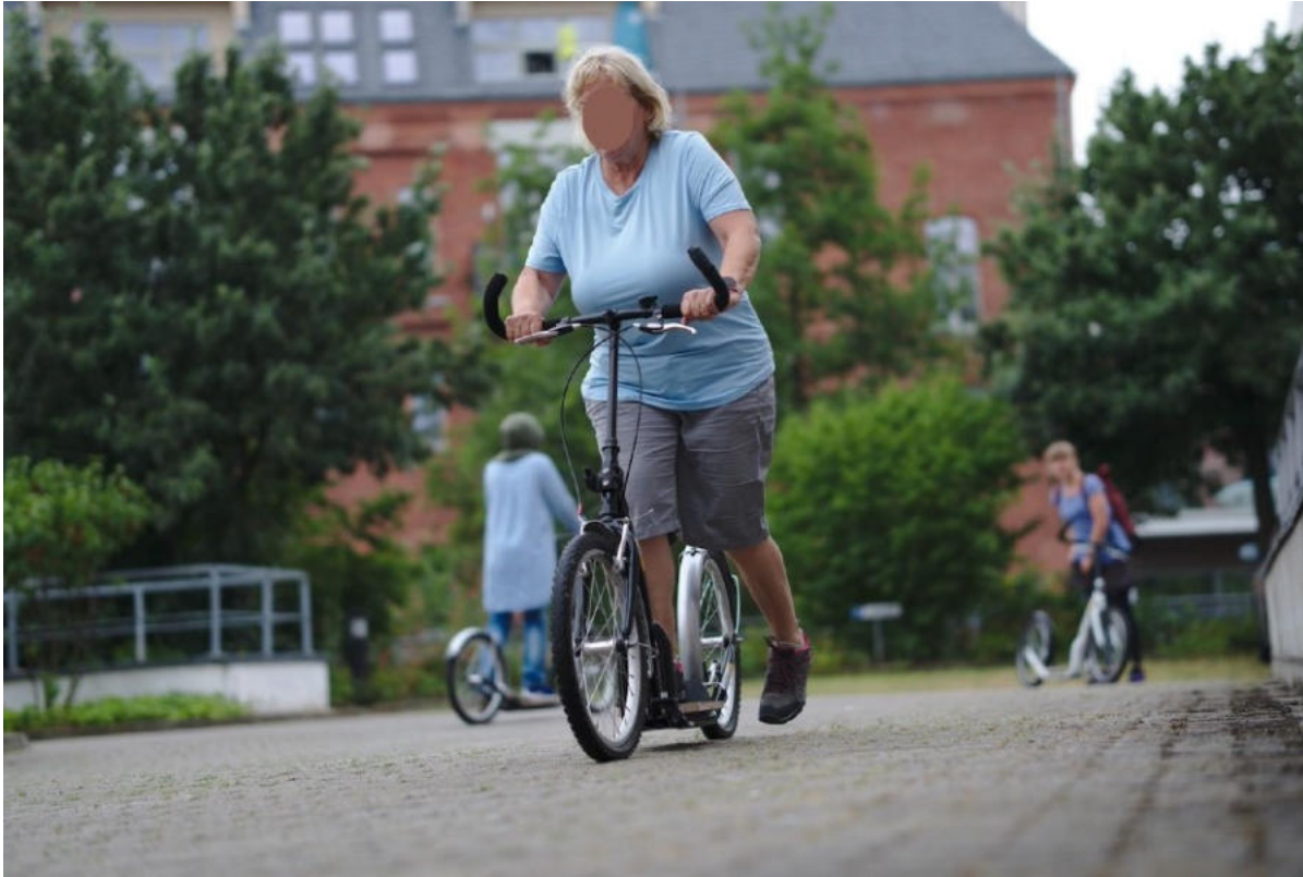
Wiedereinstieg mit Erwachsenenroller