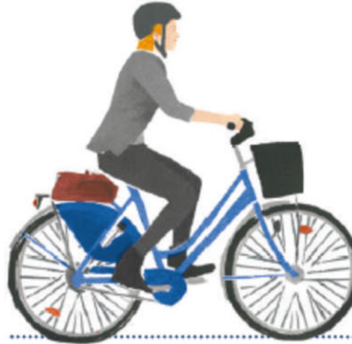
„6,5 % Begeistert und Überzeugt“

Zielgruppen für betriebliche Fahrsicherheits-trainings